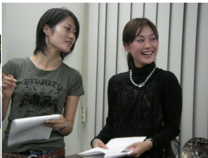
デートDV予防プログラム