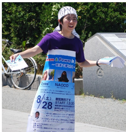
デートDV予防イベント